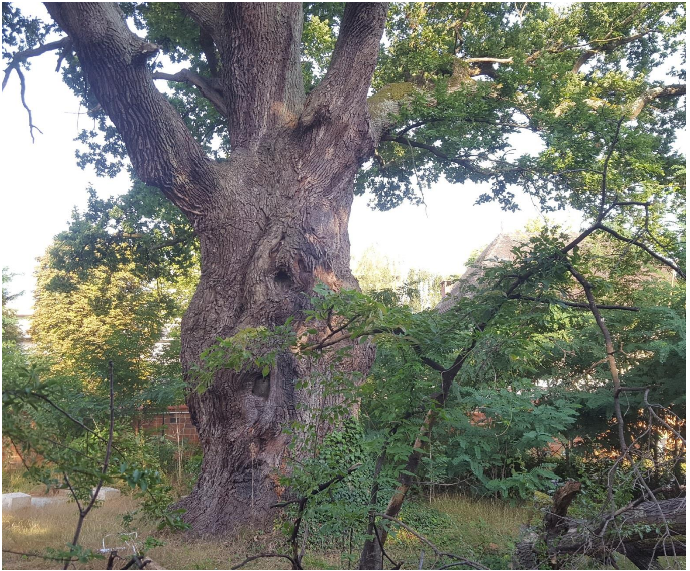
Le Grand Chêne en 2024