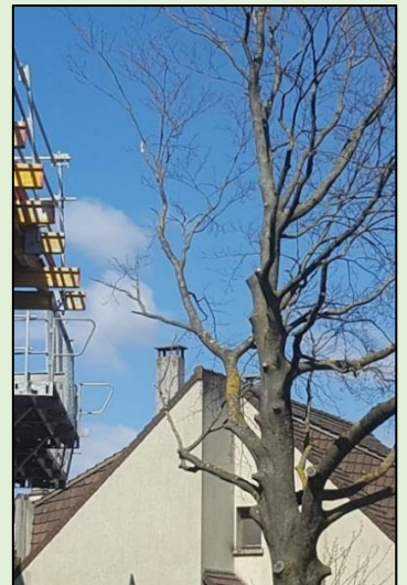
Sur un autre chantier de Saint-Maur, voilà ce qu'est devenu un arbre remarquable dit « protégé »